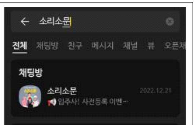
소리소문 입력 후 해당 채널 추가